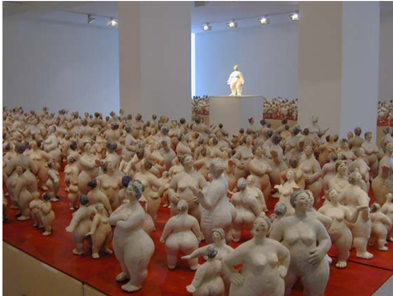
Villach, Städtische Galerie

mehr unter http://www.theresia-hebenstreit.de/ausstell.htm