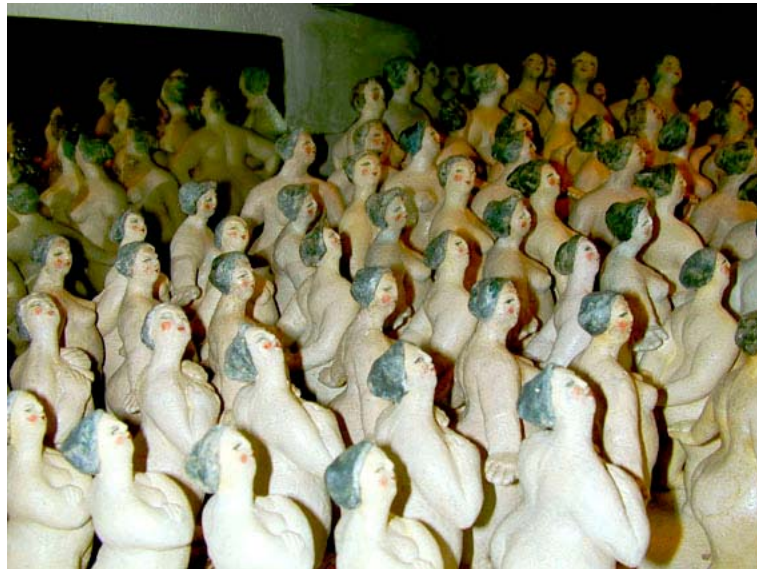
Werkstatt Wiesbaden, der Damensalon

Bis April 2006 habe ich hier in meiner Werkstatt alle 1001 Figuren bemalt, geschminkt und signiert. Sie bekamen damit ihre einmalige Note und die Fertigung des Projekts 1001nackt war abgeschlossen.