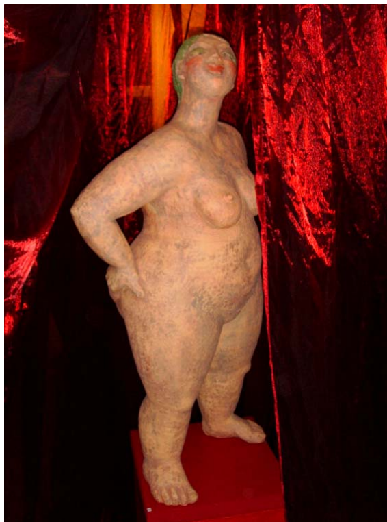
Susanna unter der warmen Dusche

Vom 17.- 21.11.06 feierte ich in meiner Werkstatt, fortan Damensalon genannt, ein 1001NACKT Fest. In orientalischer Atmosphäre mit entsprechendem Essen und Musik wurden die ausgestellten Figuren bestaunt, befühlt und gekauft. So fand die noch ofenfrische, etwa 1m große Susanna unter der warmen Dusche , fast zu schnell, glückliche Besitzer. Es kamen viele Freunde und es waren wunderbare und anregende Tage. http://www.theresia-hebenstreit.de/ausstell.htm