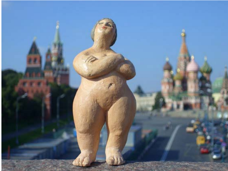
Luzie in Moskau

Im September stellte ich meine Arbeiten auf der Ambiente Rossija in Moskau vor, wo sie großes Interesse fanden. Meine engagierte Stand-Betreuerin und Übersetzerin Olga Tihomirova fotografierte Luzie in ihrer Heimatstadt Moskau.